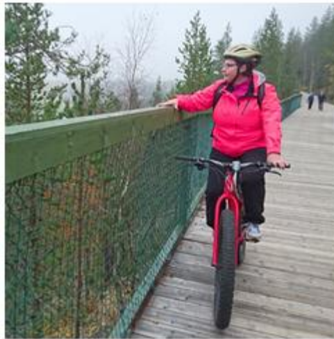
Fyysisen aktiivisuuden, liikkumattomuuden ja kunnan seuranta